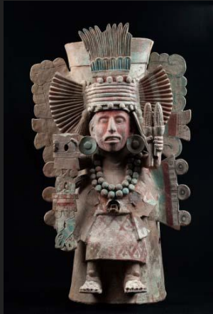
Xilonen “Diosa del maíz”

“Al igual, una segunda ceremonia llamada Ochpaniztli , la cual celebraba el fin de las cosechas y se le ofrecía a Toci “nuestra abuela” (madre tierra), “Se decapitaba a una mujer en las mismas condiciones. La piel de la víctima desollada servía para revestir a un sacerdote. En ambos casos, actuando por detrás, el ejecutor parecía mimar un ataque por sorpresa (16).”